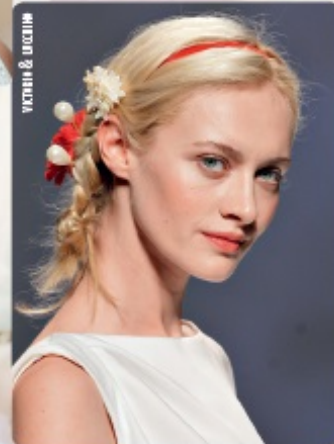
VICTORIA & UCCINI

“LA VERA BELLEZZA È RIMANERE FEDELI A SE STESSI. È L'UNICA COSA CHE FA SENTIRE BENE”