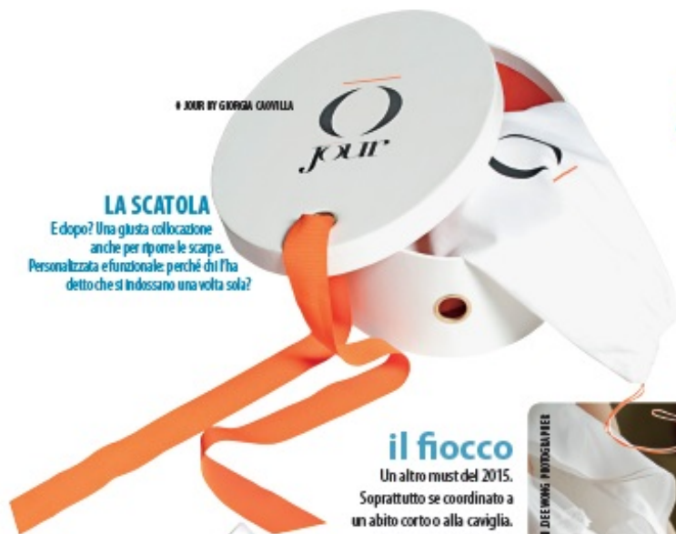
8 XXIII BY GIORGIA CAVILLA