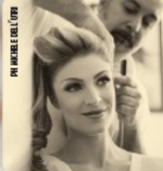
PI MARILE DEL L'OPPI

Indipendentemente dal tipo di acconciatura che sceglierete, ricordatevi di nutrire i capelli nei mesi precedenti, stimolando la produzione di collagene ed elastina. Consiglio spassionato: non azzardate tagli radicali o colori strong, il risultato potrebbe non piacervi! Cominciate qualche mese prima a fare le prove di "parrucco" e affidatevi solo a mani esperte: l'acconciatura - anche quella apparentemente più semplice - richiede uno styling studiattissimo, soprattutto perché dovrà essere impeccabile per l'intera giornata.