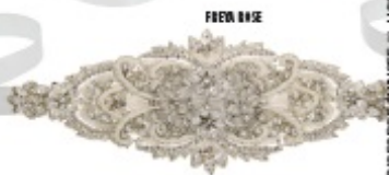
FIERA DI SE

Per qualunque tipo di acconciatura e qualunque taglio di capelli, l'accessorio può dare un tocco in più a voi (e al vostro abito). La scelta è tanta: fascinator e cappelli, veli e velette, cerchietti, pettinini, fasce di vari spessori oppure fiori freschi (ma attenzione alla stagione e all'equilibrio dei volumi) e, per un effetto principessa, il diadema!